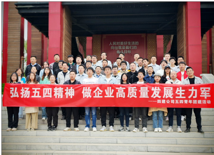
弘扬五四精神 做企业高质量发展生力军 ——四建公司五四青年团建活动

杭州项目部团支部组织广大团员青年观看影片《长空之王》。该片讲述雷宇等年轻试飞员在队长张挺的带领下，为获取最极限的数据，一次次冒着生命危险，只为试出最新型隐身战机的故事。年轻一代以雷宇为代表的青年人，从一开始遇到问题直接跳伞，到最后为把队友和飞机数据带回来而