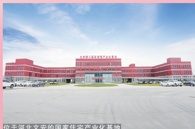
位于河北文安的国家住宅产业化基地

20年来,新材公司从单一的混凝土产业到预拌混凝土、装配式+被动式超低能耗建筑、物流检测服务业、新材料产业的多元化发展格局,总资产从1.68亿元上升到70.23亿元,增长41.8倍;年营业收入从1.76亿元到40亿元,增长21.72倍,职工年平均收入增长了19倍。20年间,新材公司谱写了高质量发展的辉煌诗篇。