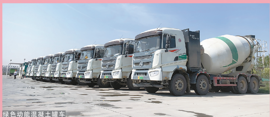
绿色动能混凝土罐车