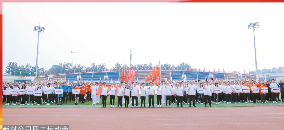
新材公司职工运动会