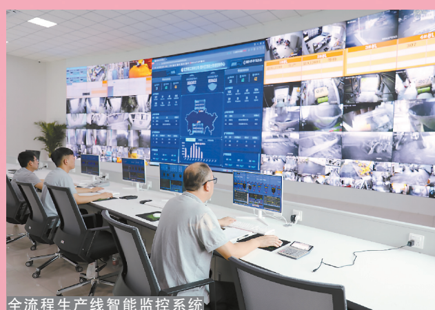
全流程生产线智能监控系统