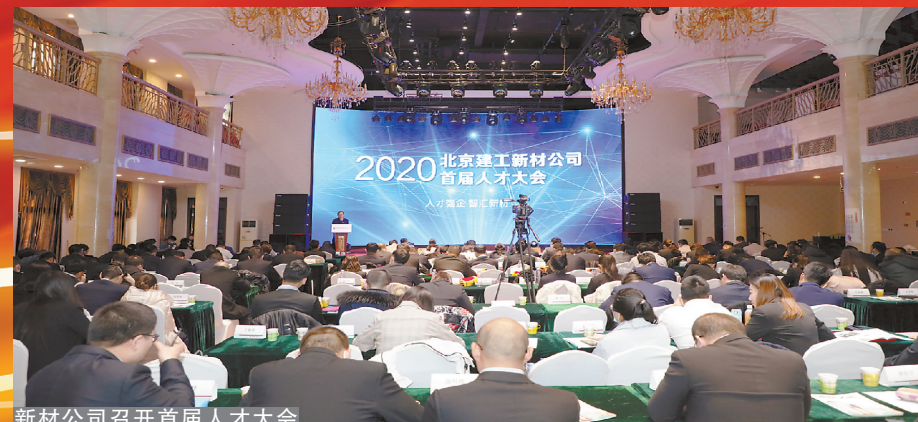
新材公司召开首届人才大会