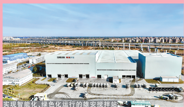
实现智能化、绿色化运行的雄安搅拌站