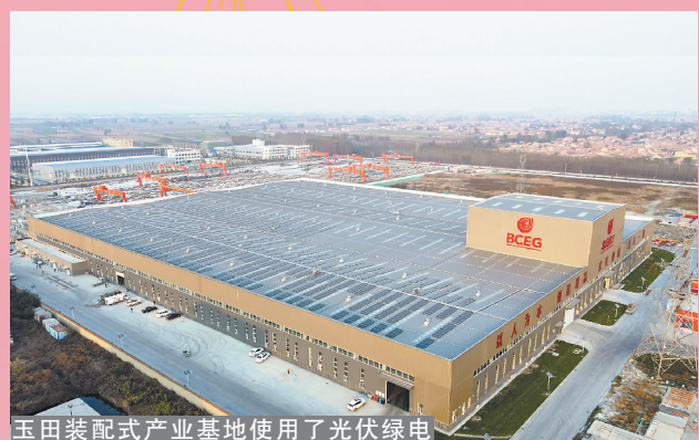
玉田装配式产业基地使用了光伏锂电