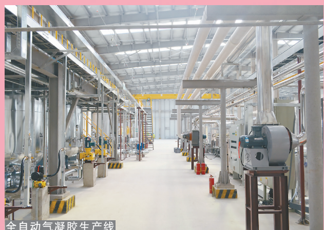
全自动气凝胶生产线