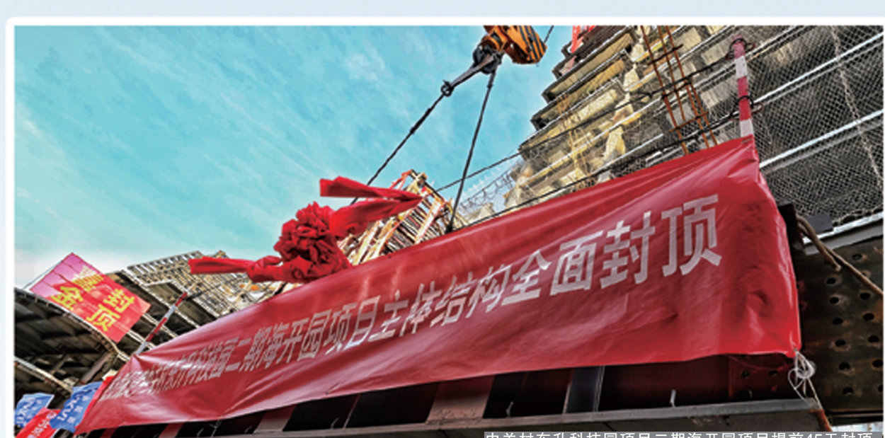
中关村东升科技园项目二期海开区项目提前45天封顶。