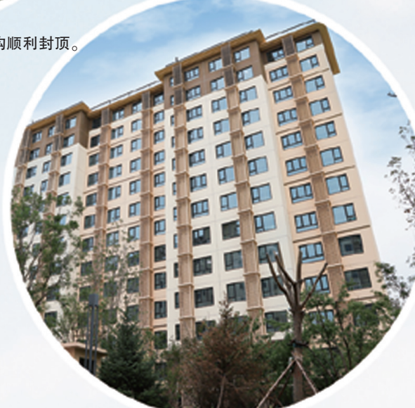
海淀区瑞泽家园项目集中入住交付。