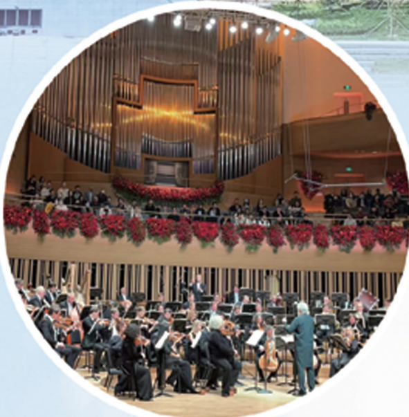
北京艺术中心迎来世界级交响乐团演出。

近期,集团一批重点工程相继迎来开工、封顶、竣工等重大节点,为打好全年目标任务收官战奠定了坚实基础。