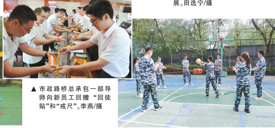
市政路桥总承包一部导师向新员工回赠“回徒贴”和“戒尺”。