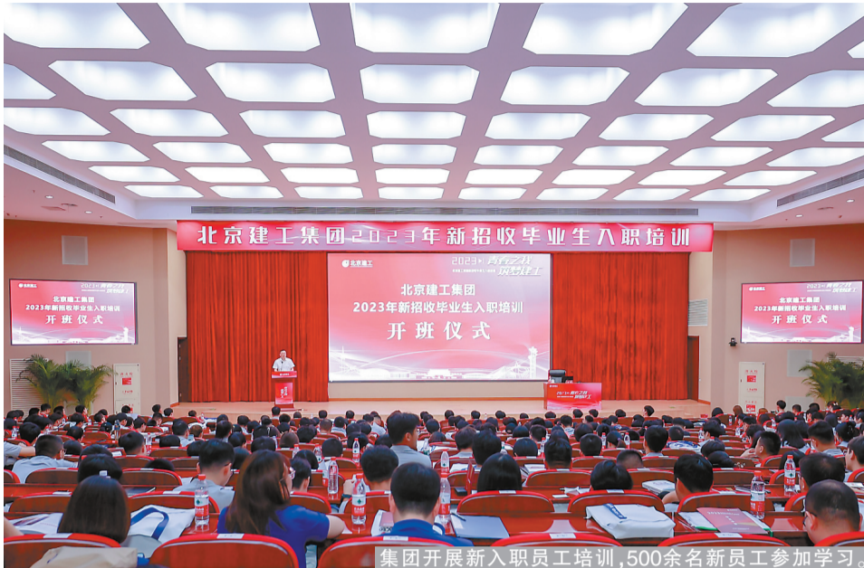
集团开展新入职员工培训，500余名新员工参加学习

近日，技术公司下属锅炉公司组织开展了6场“供热服务进社区”活动，涵盖5个社区、8个服务点位，服务居民1122户，推动了供热宣传、维修服务、缴纳费用等举措便捷化、暖心化。 活动以解决群众最关心、最直接、最现实的供热问题为出发点，来自锅炉公司各岗位的业务骨干向居民讲解供热政策，用案例、照片等直观形式让居民迅速了解供热常见问题、掌握简单解决方式，手把手教会老年用户使用“易缴费”功能缴纳供暖费用。同时，前来的居民们被一旁的“流动便民服务窗口”吸引，上面有“五心”服务理念、安全用热常识、故障报修卡等内容。 锅炉公司负责人表示，接下来将持续开展“供热服务进社区”活动，深入与居民互动交流，及时了解居民需求，进一步推动沟通渠道“零距离”、提高居民用热“安全感”。 (刘晶晶)