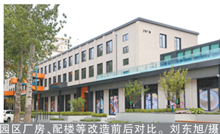
北京卫星制造厂科技园厂房、配楼等改造前后对比。