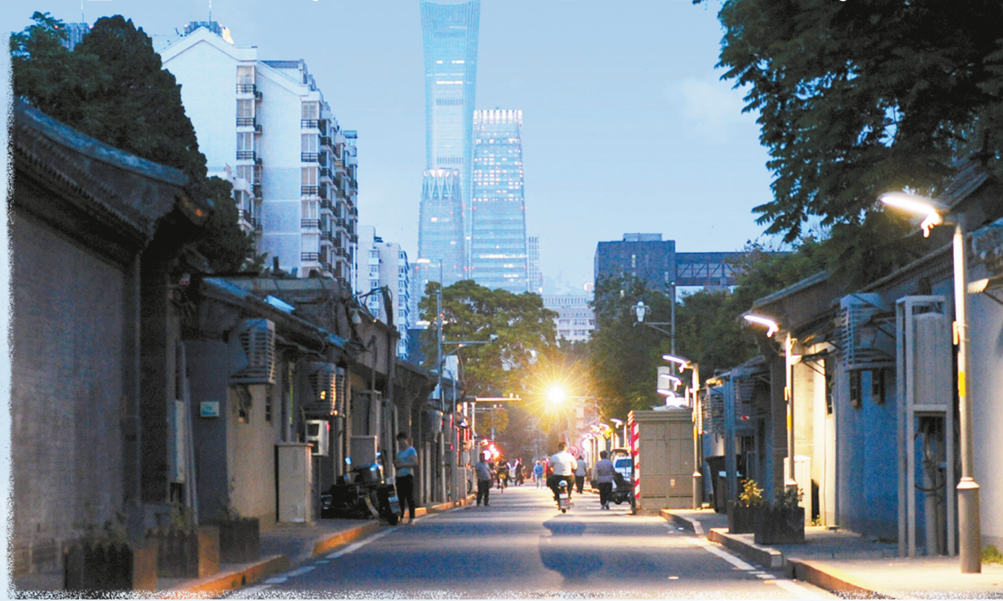
▲东城区建国门街道西总布街区申请式退租和恢复性修建项目街景。