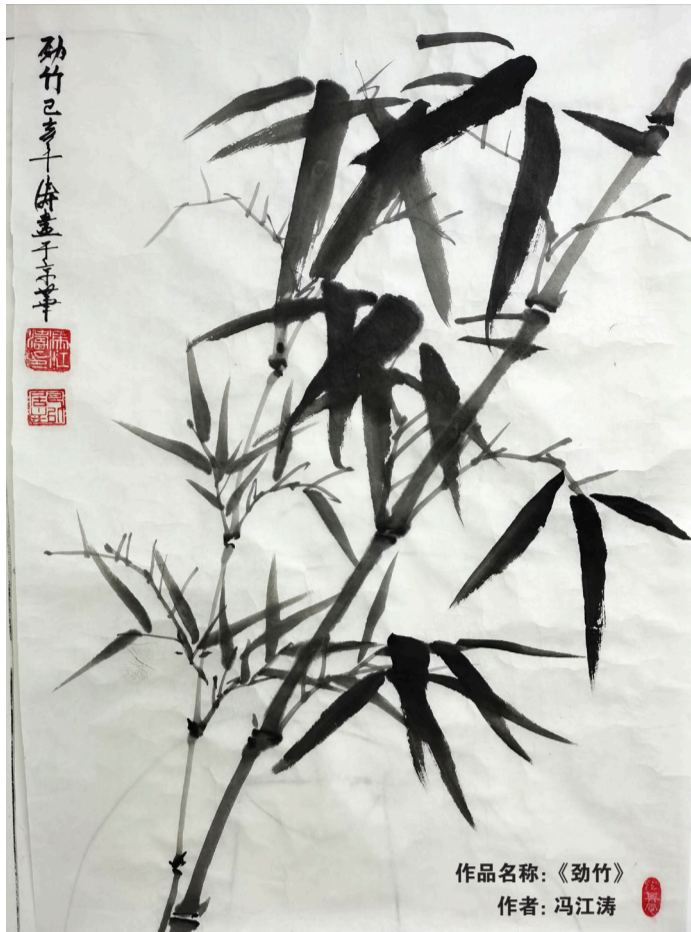
作品名称:《劲竹》 作者:冯江涛