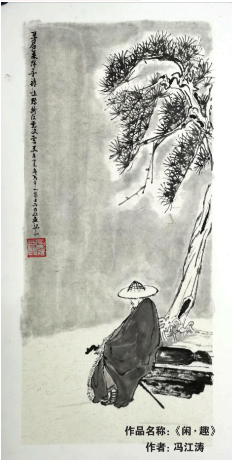
作品名称:《闲·趣》 作者:冯江涛