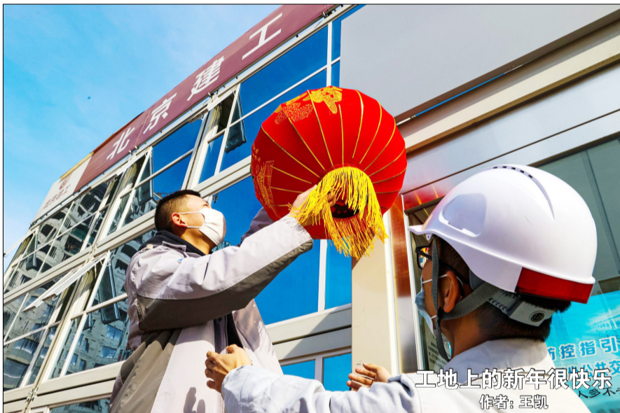
工地上的新年很快乐 作者: 赵凯