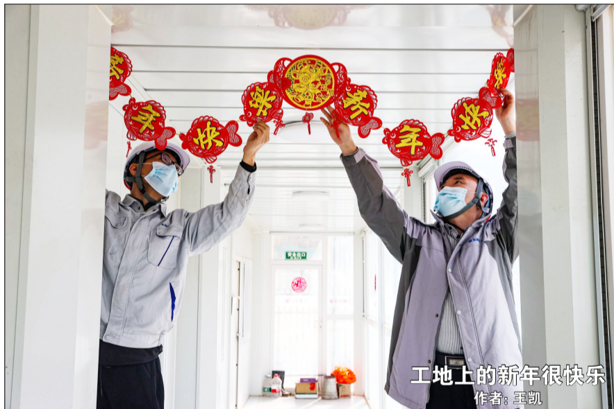
工地上的新年很快乐