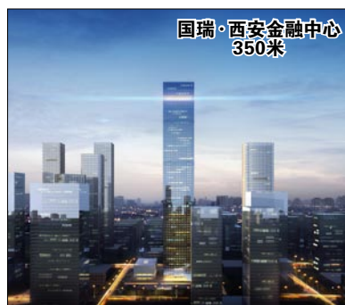
国瑞·西安金融中心 350米