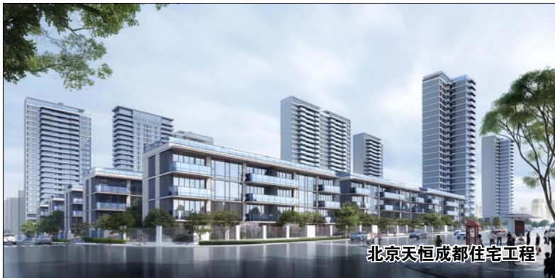
北京天恒成都住宅工程