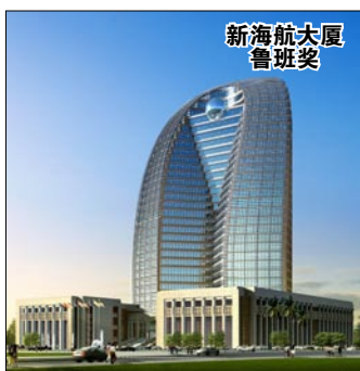
新海航大厦 鲁班奖