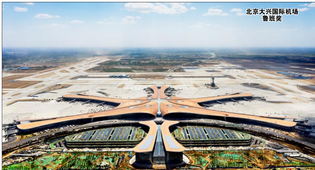
北京大兴国际机场 鲁班奖

五年乘风破浪，五年砥砺前行！ 站在“十三五”即将收官的时间节点上 北京建工交出了一份亮眼的成绩单： 年新签合同额突破2000亿元 年营业收入突破1000亿元 企业总产值突破1000亿元 利润总额增长近4倍 连续跻身 全球最大250家国际承包商、中国企业500强 走过60多年不凡历程的北京建工 以勇当冠军的奋斗姿态迈向“十四五”新征程