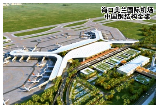
海口美兰国际机场 中国钢结构金奖

五年来，习近平总书记多次视察北京、对北京发表重要讲话。在北京大兴国际机场投运之际，习近平总书记勉励广大建设者，共和国的大厦是靠一块块砖垒起来的，人民才是真正的英雄。奇迹是干出来的，社会主义是干出来的。希望广大建设者在新的征程上再接再厉、再立新功！