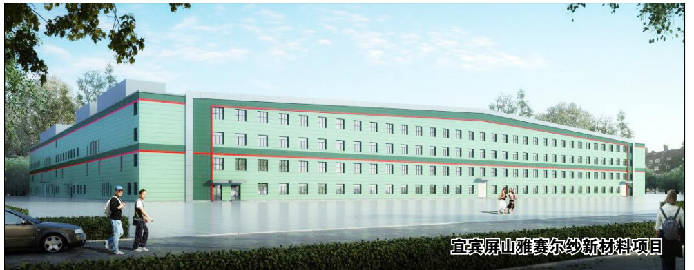
宜宾屏山雅赛尔纱新材料项目

本报讯(通讯员 李天龙)年新签合同额25亿元,在施面积100万平米,年施工产值7亿元,人均产值600万元,所有项目按期履约,人员数量翻倍,人才素质大大提升……近日,重庆分公司2020年终统计结果出炉,各项考核指标数据达到了历史最高峰,没有辜负公司领导的期望,向公司交出了满意的答卷。随之一路走高的,还有分公司全体职工的信心与士气。可以肯定的是,在川渝区域,四建重庆分公司已经站稳脚跟,成为公司京外区域发展的中坚力量。