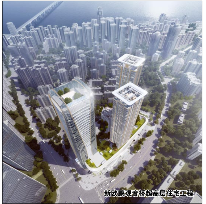
新欧鹏观音桥超高层住宅工程