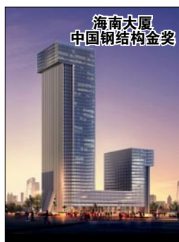
海南大厦 中国钢结构金奖