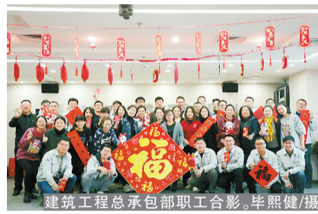
建筑工程总承包部职工合影。

新春到来之际，职工们一起贴福字、挂灯笼，将共同奋斗的厂区装扮得红红火火，盼望着来年继续努力。