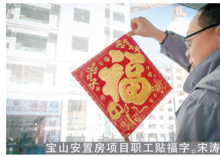
宝山安置房项目职工贴福字。

技术公司下属锅炉公司举办了欢乐小年夜活动，职工们在“筷子夹球”“你写我猜”“一圈到底”等团队项目中拉近了彼此间的距离，增强了团队凝聚力。