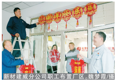
新材建成分公司职工布置厂区。

又一个春天即将到来，集团广大职工纷纷行动起来，怀着喜悦的心情动手装点办公室。写福字、剪窗花、贴春联、举办游园会……他们带着对大家庭的热爱，将对新一年的向往和希冀倾注到每一项活动中。