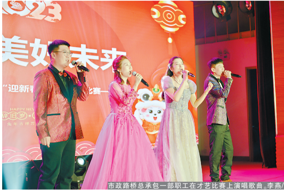
市政路桥总承包一部职工在才艺比赛上演唱歌曲。