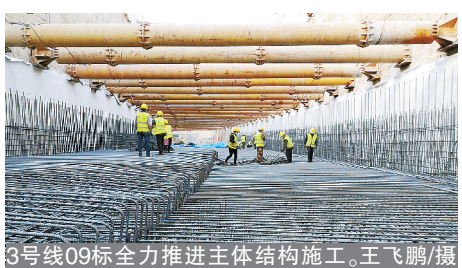
3号线09标全力推进主体结构施工。