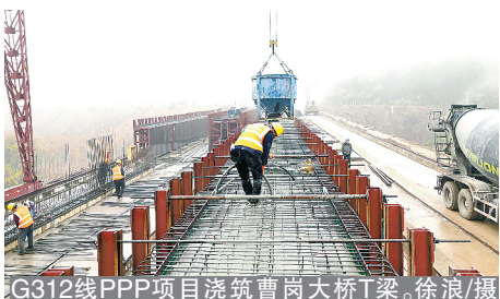
G312线PPP项目浇筑曹岗大桥T梁。

浙江嘉善善钧锂电池项目部“大干三个月,冲刺年底竣工”劳动竞赛正在持续开展中。竞赛以保进度、保质量、保安全文明施工