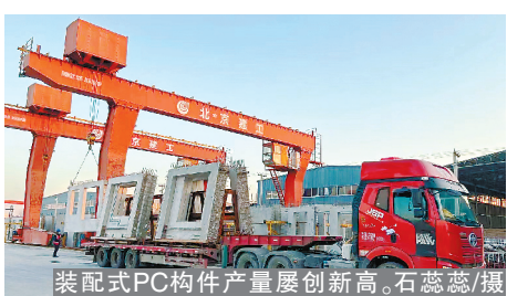
装配式PC构件产量屡创新高。

为主要目标,围绕“六比六赛”的主要内容,充分调动全体施工人员的主动性和创造性。目前,项目正处于装饰装修及市政施工阶段,并通过市优质结构工程评审初验,向年底竣工交付及争创“嘉兴市南湖杯”的目标冲刺。