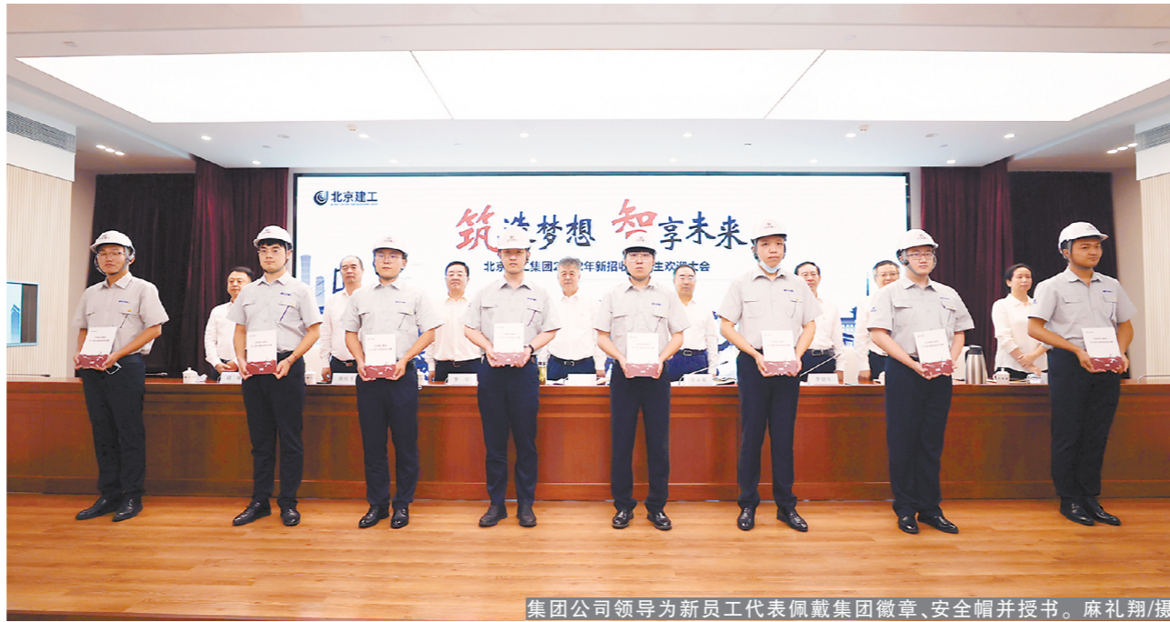
集团公司领导为新员工代表佩戴集团徽章、安全帽并授书。

樊军向新员工提出了殷切期望。一是要放大格局,做理想远大、信念坚定的新北京建工人。要以推动企业腾飞、行业进