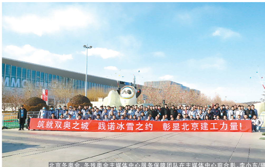
北京冬奥会、冬残奥会主媒体中心服务保障团队在主媒体中心前合影。

本报讯(记者麻礼翔 通讯员张沛町 张柯)近日,集团多个北京冬奥会、冬残奥会保障团队相继解除封闭,从闭环胜利而归。一封封感谢信也纷至沓来,对集团参与北京冬奥会、冬残奥会服务保障人员的辛勤付出与出色表现给予了巨大褒奖和充分肯定。