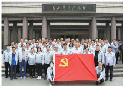
(通讯员 秦一夫) 按照公司党委

有关党史学习教育的总体工作安排，公司党委以主题党日活动的形式，组织公司中层及以上党员领导干部、各基层党支部书记62人赴香山革命纪念馆开展党史学习教育，集体参观《为新中国奠基——中共中央在香山》主题展览。