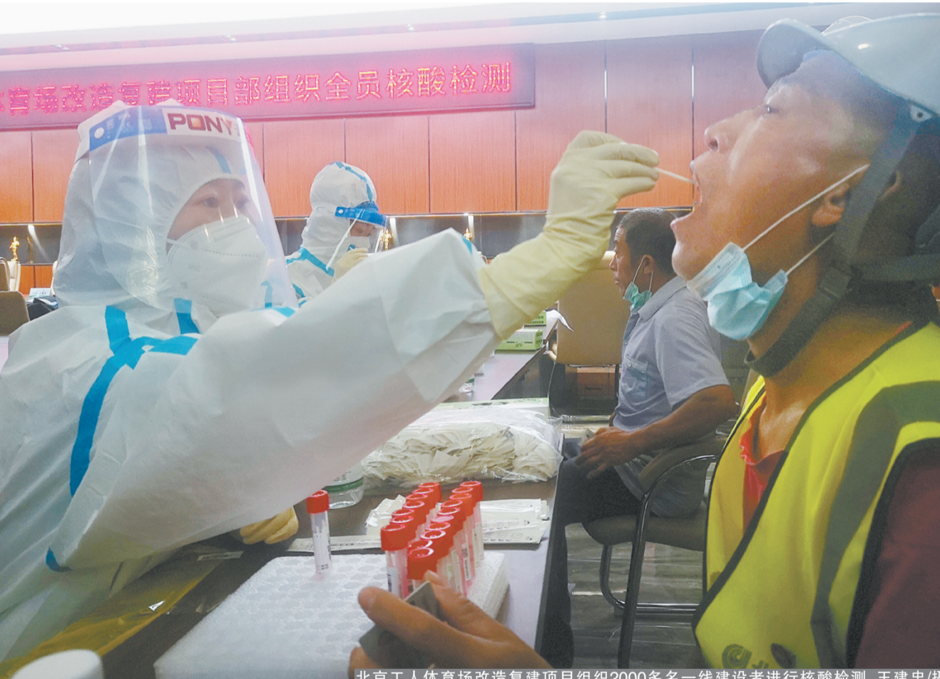
北京工人体育场改造重建项目组织2000多名一线建设者进行核酸检测。

本报讯 当前，疫情防控形势仍然严峻复杂，集团坚决贯彻习近平总书记重要批示精神，严格落实市委市政府部署要求和市住建委、市国资委工作要求，进一步压紧压实防控责任，坚决守住疫情反弹防线。