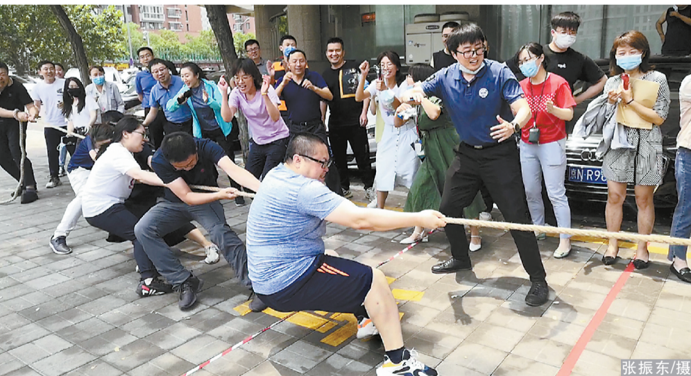
本报讯(记者杨海舰)日前,集团公司机关工会组织了趣味运动会,来自22个部门的160余名职工报名参加。

比赛包括跳绳、踢毽子、掷沙包、托球跑、摸石头过河5个人项目和拔河、一圈到底、依背赛跑、两人三足、球行万里5个团体项目,分别利用7个工作日的中午时间进行,以趣味性为主,同时考验团队协作能力和个人竞技水平。为促进部门之间的沟通,比赛规定,人数不足7人的部门可跨楼层组队参赛,但不允许同楼层部门组队。