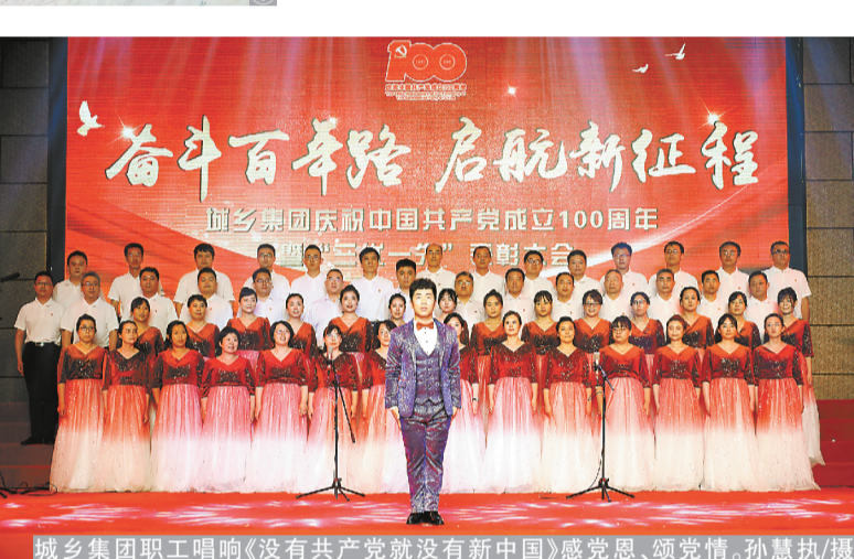
城乡集团职工唱响《没有共产党就没有新中国》感党恩、颂党情。