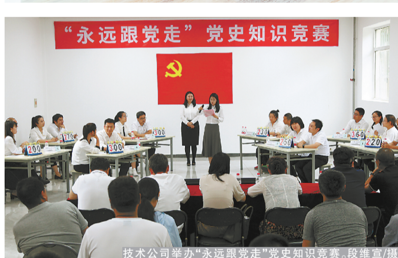
技术公司举办“永远跟党走”党史知识竞赛。