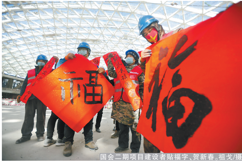
国会二期项目建设者贴福字、贺新春。