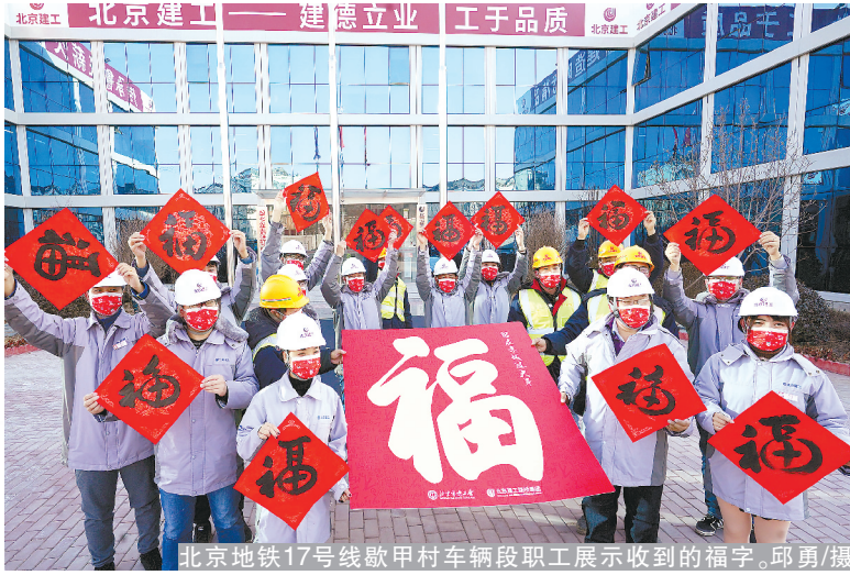
北京地铁17号线歇甲村车辆段职工展示收到的福字。

鼠辞旧岁，牛报新春。临近春节，集团各单位党政工团组织深入京内外施工项目，慰问一线职工、劳模先进、离退休老同志和困难职工，并通过邮寄慰问信、电话慰问等形式将新春佳节的亲切问候和美好祝福送到职工群众身边。与此同时，各单位积极开展线上慰问、线上联欢等活动，引导广大职工度过一个欢乐祥和、健康安全的新春佳节。暖心的祝福如同寒冬里的火焰，温暖和煦着我们脚下的前行路。征途漫漫，惟有奋斗。在未来的道路上，让我们勠力同心、披荆斩棘，以勇立潮头的勇气、只争朝夕的劲头、真抓实干的作风，共同谱写企业融合发展、创新发展、高质量发展的新篇章。