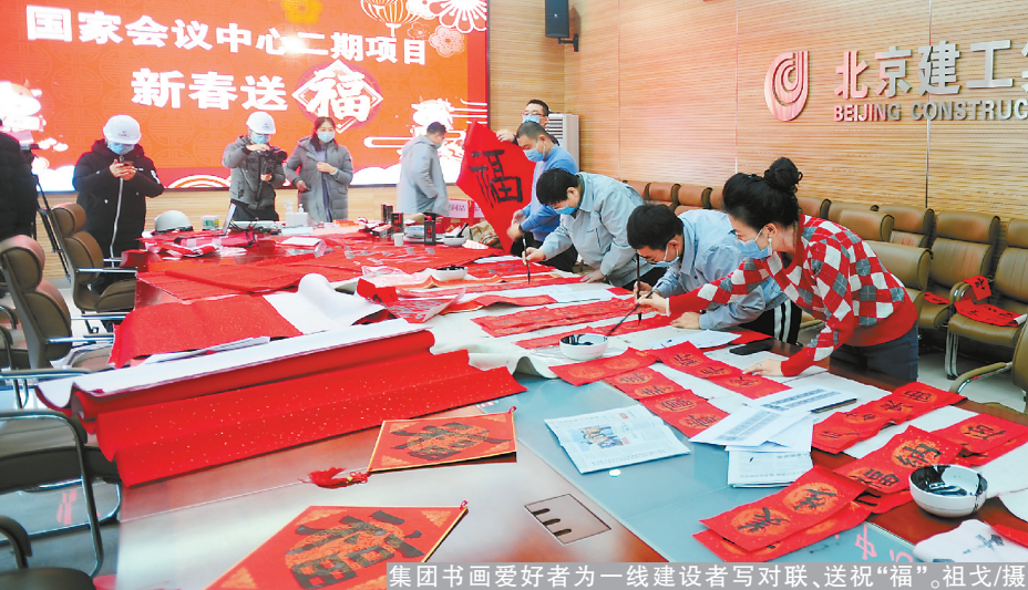
集团书画爱好者为一线建设者写对联、送“福”。

本报讯(通讯员王喜青于喆)近日，资源公司工会组织开展了“国潮手作，玩转年味”手工艺品DIY活动。活动中，资源公司工会邀请专业团队讲授牛扩香石、好运年宵花和如意弦丝画的制作方法。在老师的指导下，大家在石膏福牛上绘制出色彩斑斓的图案，然后再选择不同香味的精油滴在上面，香气十足、造型美观的扩香石就完成了。在年宵花制作中，职工们将银柳、莲蓬、发财果等花枝错落有致地插入花桶，并装饰上各种中国风元素的挂件，一盆盆喜气洋洋的“年宵花”就呈现在大家眼前。“我们选了如意、吉祥图案的弦丝画底稿，寄托对新一年的美好期待。”大家手握小锤，按照从右往左、自上而下的弦丝画制作方法，用钉子钉满底稿，再用金线进行重叠缠绕，直到图案成型。大家纷纷表示，不仅体验了不同种类手工艺品制作的乐趣，更提前感受到了浓浓的年味。