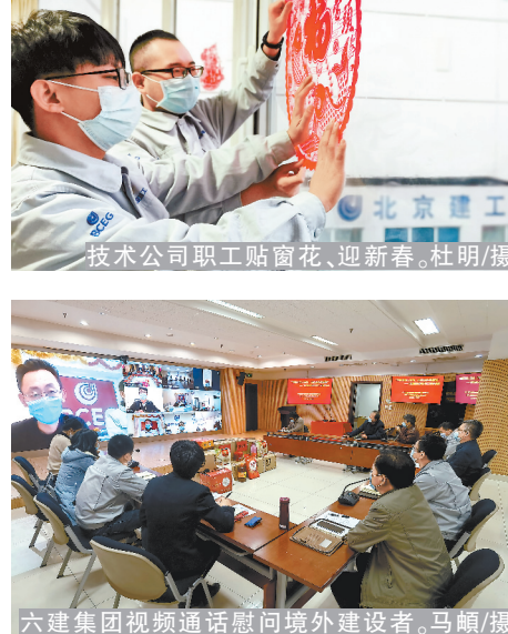
六建集团视频慰问境外建设者。

“感谢公司领导，工作那么忙还惦记着我，看到企业发展得越来越好，我发自内心的高兴。”装饰集团领导班子带队到劳动模范和退休老干部家中走访慰问，为他们送上企业的关爱和诚挚的问候。二建公司心系劳模、离退休老干部和困难职工，制定了专项“送温暖”工作方案，送去了大米、水果等慰问品，将组织的温暖和企业关怀送到职工心中。“离退休老干部和困难职工为企业付