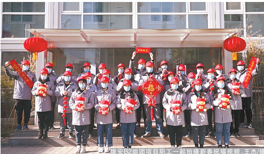
雄安B2组团项目职工一起拍摄新春祝福视频。

“根据疫情防控要求，不能举办大规模聚集性活动，所以今年我们组织职工在网上联欢过年。”地产公司工会以工会分会和直属工会小组为单位排练文艺节目、录制拜年视频，为大家献上一台精彩的“网络春晚”。投资公司领导班子带队到国通公司、建元城投公司通州文旅区管廊运维项目等开展慰问活动，送去了慰问品，向春节期间值班值守的干部职工送去了亲切的问候。技术公司领导班子带队深入一线，向一直以来奋斗在各岗位上的职工表示感谢，同时鼓励大家坚定信心、再接再厉，以饱满的精神状态积极投入新一年的各项工作中。装饰集团工会为职工们准备了电影票、公园票，并倡导职工在网上观看故宫、国家博物馆的“云展览”，过一个既有意思更有意义的春节。