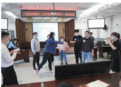
本次赛事以“互联网+动静结合”为原则,对赛制和观赛形式进行了改良,

同时紧密结合当下的疫情防控、生产安全和综合管理等话题出题。由于疫情原因,本次知识竞赛通过现场观赛和直播观赛两种形式,坚守在一线的青年职工通过虎牙直播平台观看了赛事全程。赛事分为初赛和复赛,初赛采用问卷星线上答题形式选出前6名,决赛的“眼疾手快”和“动静结合”两个环节引入了气锤、安全帽和倒计时爆炸气球等道具,考验了参赛选手们在极端环境下的应答能力。选手们面对试题沉着应对,现场气氛热烈,整个会场洋溢着紧张又活跃的良好氛围。