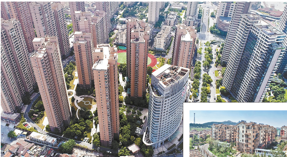
↑ 上海建邦16区项目获评上海市虹口区首个2A级生活小区。 → 济南建邦原香溪谷项目充分体现了新型城市化居住生活理念。

对品质的一贯追求，是“北京建工地产”品牌得到市场广泛认可的重要因素之一。地产公司不仅在商业地产项目上追求卓越品质，还匠心打造了一系列精品保障性住房项目，始终坚守着“保障房标准不低于商品房标准”的原则。 作为国有企业，地产公司坚持将践行国企社会责任融入到企业高质量发展的总体规划中，近年来倾心打造了宋家庄家园、双合家园、永顺家园、西山荟景家园等“家园”系列保障房产品。从经济适用房到廉租房，从自住型商品房到共有产权房，地产公司累计开发保障性住房面积突破100万平方米，为超过5万