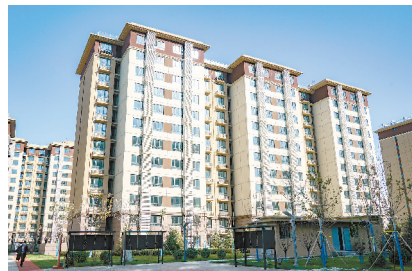
↑ 打造永顺家园共有产权房。10年来，累计开发保障性住房超100万平方米。

“坚持党的领导是做好各项工作的根本保证，是战胜一切困难和风险的‘定海神针’。”地产公司党委始终坚持将党建引领贯穿到企业改革发展的全过程，引领推动企业实现高质量发展。