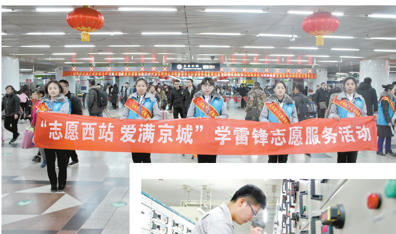
↑ 十余年如一日，在北京西站地区开展志愿服务。

多年来，置业公司党委始终勇于担当国企使命，配合集团完成8.2万平方米代管非经营性资产移交工作，积极参加庆祝新中国成立70周年服务保障