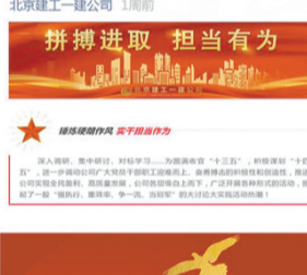
【锤炼硬作风 践行“冠军文化”】科技发展部党委理论中心组开展专题研讨