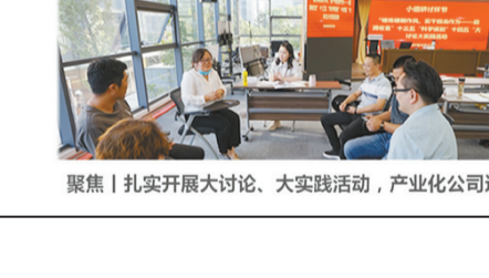
【锤炼硬作风 践行“冠军文化”】科技发展部党委理论中心组开展专题研讨