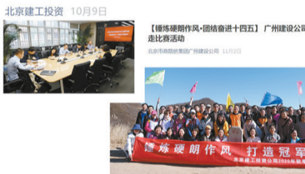
【锤炼硬作风 践行“冠军文化”】科技发展部党委理论中心组开展专题研讨