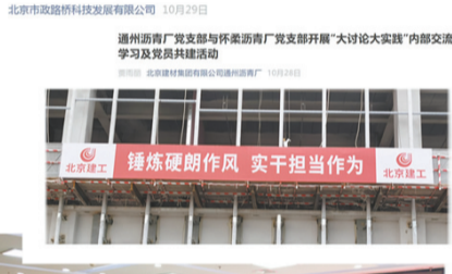
【锤炼硬作风 践行“冠军文化”】科技发展部党委理论中心组开展专题研讨