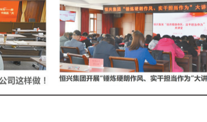
【锤炼硬作风 践行“冠军文化”】科技发展部党委理论中心组开展专题研讨