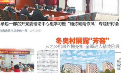
【锤炼硬作风 践行“冠军文化”】科技发展部党委理论中心组开展专题研讨