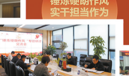
【锤炼硬作风 践行“冠军文化”】科技发展部党委理论中心组开展专题研讨