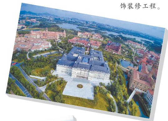
↓ 耗时两年，悉心打造华为松山湖精品装饰装修工程。