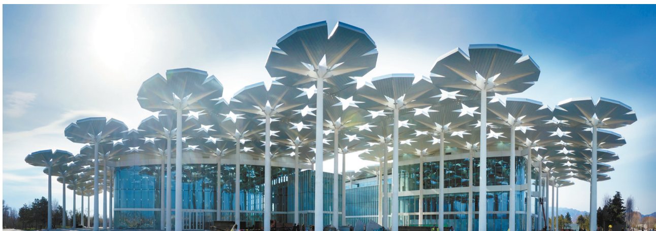
由94把钢铁“花伞”构成的国际馆惊艳亮相2019年北京世园会，并荣获中国钢结构金奖。