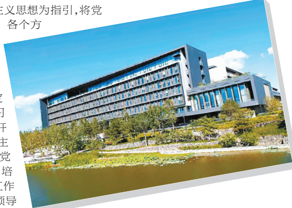
← 城市副中心行政办公区B3工程获得鲁班奖。自成立以来，六建集团累计斩获20尊鲁班奖。

“使全体干部职工在改革发展中有更多获得感”是六建集团党委的根本出发点和最终落脚点。站在新的历史节点上，六建集团党委将继续坚定发展信心，保持战略定力，抢抓市场机遇，应对困难挑战，以优异成绩向集团公司第三次党代会献礼！