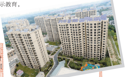
← 圆满完成团河首创美湖湾定向安置房建设任务，打造了北京市保障房建设标杆工程。