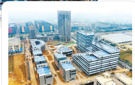
圆满完成合肥高新区明珠产业园项目建设任务。

集团第二次党代会特别是“十三五”以来，在集团公司党委的坚强领导下，五建集团党委全面加强党的领导，抢抓机遇、应对挑战，走出了一条不平凡的追梦之路。截至2020年10月底，五建集团在“十三五”期间累计实现新签合同额近300亿元，完成产值176亿元，各项经济技术指标均超额完成集团下达任务，在打造“双提升”“双健康”的行业优秀企业的征程中蹄疾步稳、大步向前。