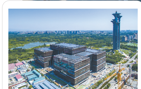
亚洲金融大厦项目获得中国钢结构金奖。

风劲帆满图新志，砥砺奋进正当时。五建集团党委将继续带领广大党员干部职工，勇往直前、勇争一流，奋力打造规模效益持续增长行业优秀企业，以优异成绩迎接集团公司第三次党代会胜利召开！