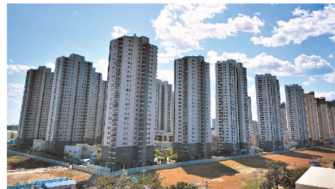
焦化厂公租房国内最高装配式超低能耗建筑。