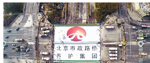
仅用43个小时完成1350吨三元桥换梁工程。

特别是在推动提质增效方面，市政路桥集团党委与经营班子制订了专项工作方案，对工程结