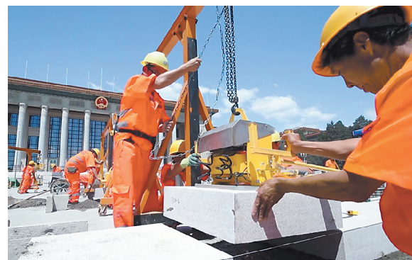
2018年，高标准完成了人民大会堂广场改造任务。