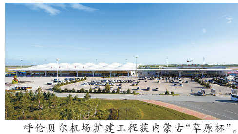
呼伦贝尔机场扩建工程获内蒙古“草原杯”。