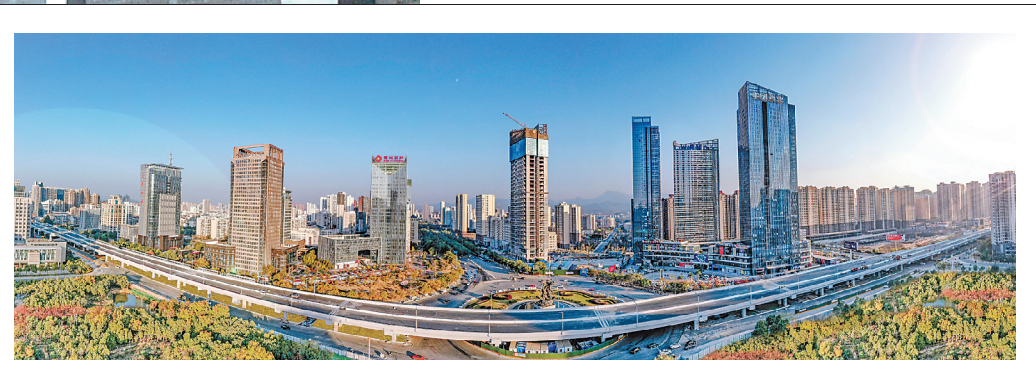
↑ 2020年5月，赣南大道快速路工程一标段全线通车。 ← 2019年9月，北京大兴国际机场线正式投入运营。

算、应存存货控制、控制融资规模、推动资金集中等分别明确了工作目标和考核办法，与目前正在推动的“三降一减一提升”专项行动高度契合。同时，加大工程结算力度，实施项目结算挂账督办，截至9月底，共完成项目结算992项，其中三年以上项目结算300项。