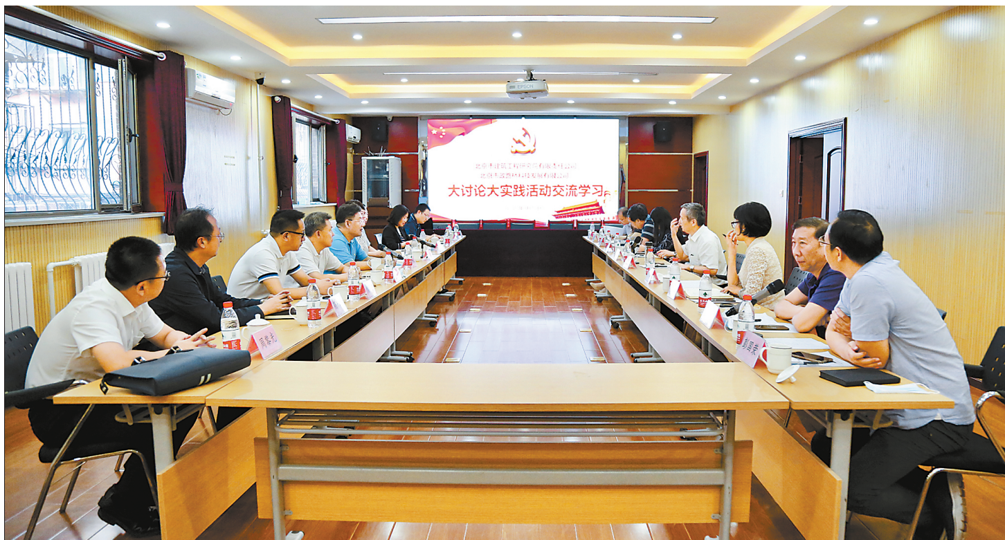
为扎实推进“锤炼硬朗作风，实干担当作为——圆满收官‘十三五’，科学谋划‘十四五’”大讨论大实践活动，9月15日下午，建研院党委负责人带队赴市政路桥集团科技发展公司开展对标交流。双方围绕科学谋划“十四五”，结合主营业务分析研判发展战略和行业形势，分享了在业务布局、强化管理、党建创新等方面的工作经验，并互相对标对表、取长补短，为下一步开展深入合作交流、推动高质量发展打下了坚实基础。 图为双方在座谈交流会上互相分享发展经验。 李静 王靖/文