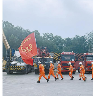
集团防汛队进行防汛应急演练,潘杨摄