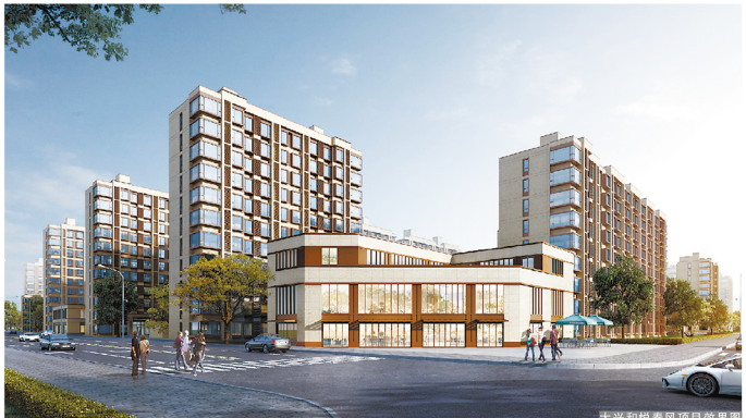
大兴和悦春风项目效果图

本报讯(通讯员张孟珂 毕睿)5月20日,由地产公司联合保利集团开发的悦春风凤凰苑项目正式开盘,开盘首日销售461套。