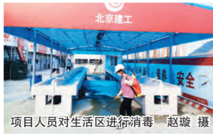
项目人员对生活区进行消毒

棚进行了加固,并对机具进行了防雨处理。在切断现场所有电源后,管理人员带领施工人员撤离至临时避难场所。