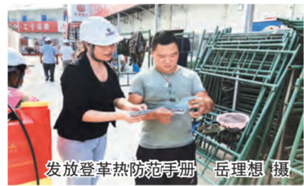
发放登革热预防手册