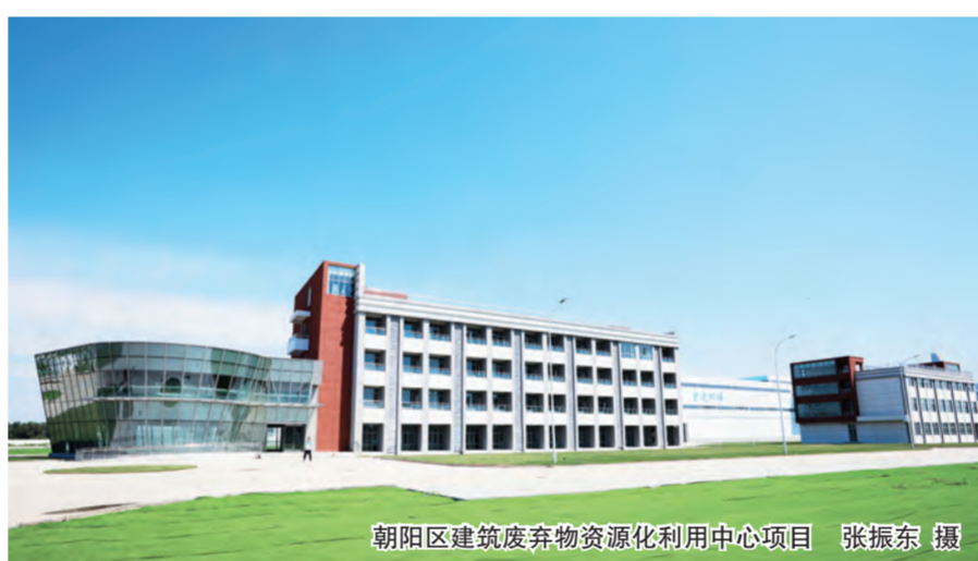
朝阳区建筑废弃物资源化利用中心项目

保其耐久性,该项目养护窑里面墙体要求必须是混凝土结构,24公分厚的墙体,高度6.2米,墙体之间净距1.3米,如果在算上支模板、加固等,墙体之间只能容得下一个人进行施工。