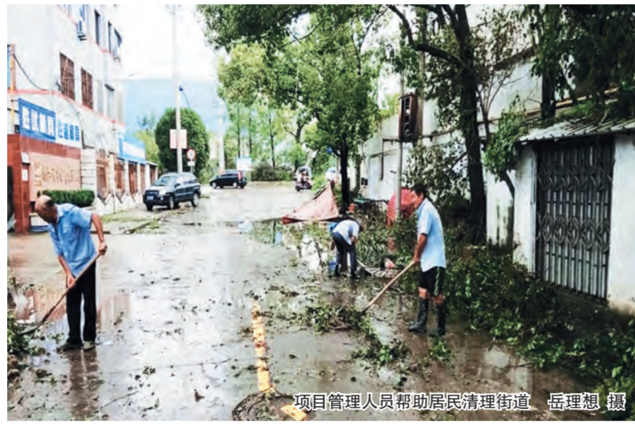
项目管理人员帮助居民清理街道