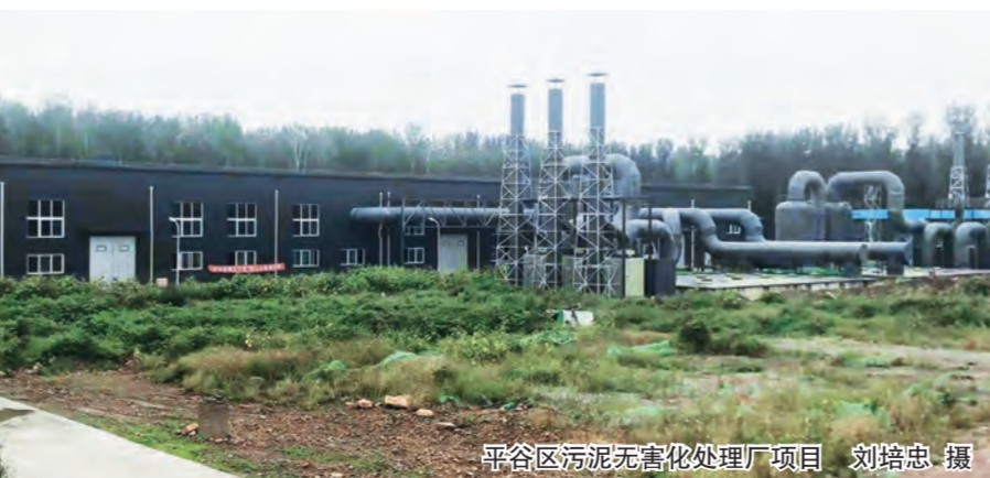
平谷区污泥无害化处理厂项目

不同其他厂房建设,平谷区污泥无害化处理厂内水池面积大,防渗漏工作是整个项目建设的重中之重。为保证地下室结构混凝土自防水质量,项目部从原材料选择、试验、配合比设计和混凝土施工控制着手,优选出满足设计强度等级、抗渗等级和耐久性,且水化热相对较低、收缩小、泌水少、施工性能良好的防水混凝土,严格控制混凝土的搅拌、运输、浇筑及养护,从而保证混凝土内外观,控制结构不出