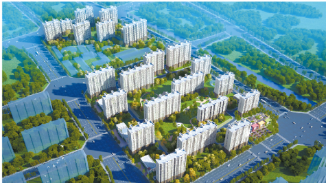
大兴区旧宫镇的0050-1号住宅楼等32座、0055-幼儿园工程效果图

今年以来,五建集团领导班子坚持高点谋划、重点突破,立足北京、深耕重点区域市场,加大大客户合作,主动对接城市副中心、雄安新区建设,市场营销工作取得丰硕成果,提前完成全年营销任务指标,进入四季度,五建集团市场营销持续发力,连续中标5个重点项目,中标金额超13亿元。截至目前,五建集团今年累计新签合同额71.56亿元。