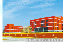
即将建成的文安基地综合楼。