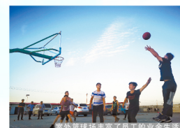
室外篮球场丰富了员工的业余生活。

在恒均科技公司生产车间的显著位置有这样一句话：“行动，是成功的唯一途径。”当前，公司全体员工正在朝着全年生产目标奋力奋进。未来，公司将进一步完善布局，提高产能，以五大核心产品服务京津冀、雄安新区市场，以“三大核心定位”为集团装配式+被动式建筑发展提供强力支撑。