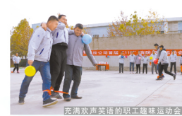
充满欢声笑语的职工趣味运动会。