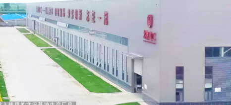
已投入使用的文安基地生产厂房。