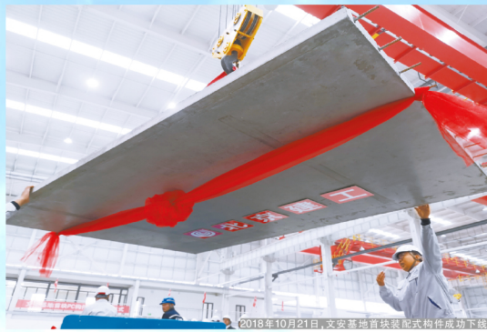
2018年10月21日，文安基地首批装配式构件成功下线。

特别是近年来，新材公司抓住国家大力发展装配式建筑的机遇，瞄准“京津冀一体化”重点区域和雄安新区建设，投资建设了昌平分公司，改造了新材公司大兴厂区PC生产线，新建了文安装配式建筑产业化基地，布局了河北玉田田装配式建筑产业园，逐步勾勒出京津冀重点发展区域的百公里供应链。