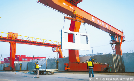
龙门吊正在码放装配式外墙板。