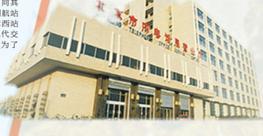
↑ 东单电话局工程是集团建成的第一座鲁班奖工程。以此为开端，集团开启了创奖历程，现已获得69项鲁班奖、40项詹天佑奖、53项国家优质工程奖。