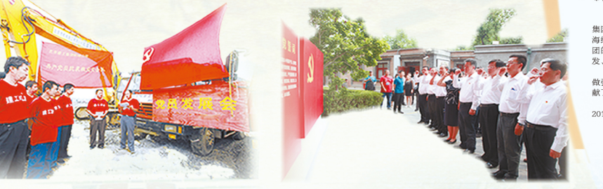
↑ 在“5.12”抗震救灾现场，集团建设者“火线入党”。集团充分发挥一线党组织战斗堡垒作用和党员先锋模范作用，圆满完成了各项建设任务。