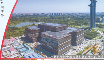
北京亚洲金融大厦和北京奥林匹克塔