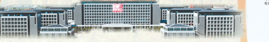
↑ 2018年5月28日，北京城市副中心A2工程顺利通过竣工验收，集团建设者发扬铁军精神，展创“副中心速度”，为国家 and 首都城市建设作出了突出贡献。