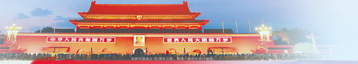
在新中国成立70周年之际，修缮一新的天安门城楼。

走进新时代，集团始终以习近平新时代中国特色社会主义思想为指导，融入国家和首都发展战略，凸显国企担当和政治责任，完成了北京城市副中心、北京大兴国际机场等重大建设任务，谱写了奋斗新时代的壮丽篇章。