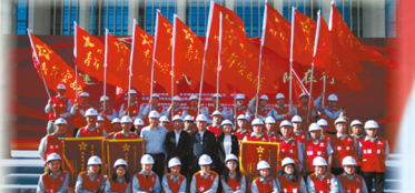
↑ 新时代，集团继续传承青年突击队精神，在各项急难险重任务中冲锋在前，发挥了重要的作用。