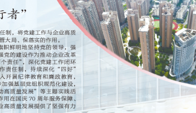
资源公司上海虹桥商务区六区项目