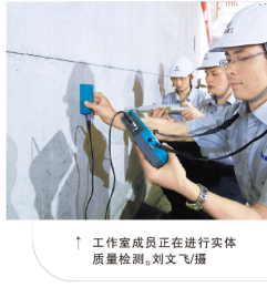
土木公司检验试验创新工作室成员正在进行实体质量检测。

本报讯（通讯员张磊）为进一步推进“8090人才工程”，近日，地产公司开展了2018年度新员工入职论文答辩工作。此次答辩旨在全面考察新员工入职后的学习成果、专业技能和综合素质，提升新员工队伍的整体素质。 答辩过程中，新员工们围绕各自的工作岗位，就入职以来的学习心得、工作感悟、专业成长等方面进行了详细汇报。评委们认真聆听，并就新员工们提出的问题进行了耐心解答。