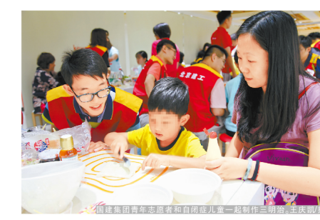
国建青年志愿者们和自闭症儿童一起制作三明治，庆祝生日

本报讯(通讯员王庆)为大力弘扬“奉献、友爱、互助、进步”的志愿服务精神，近日，国建集团团委牵头，组织集团青年志愿服务团队在昌平区丘比食品公司开展了“星星点灯我让爱，让爱从心出发”志愿服务活动。