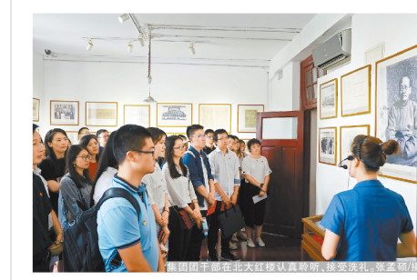
集团团委在北大红楼认真聆听，接受洗礼，立志奋进

本报讯(记者李露)为深入开展“不忘初心、牢记使命”主题教育“青年大学习”专项行动，日前，集团公司团委在北大红楼开展了“不忘初心、牢记使命”主题团日活动，教育引导广大青年干部锤炼信仰历程，更加积极主动地投身首都城市建设和集团改革发展。