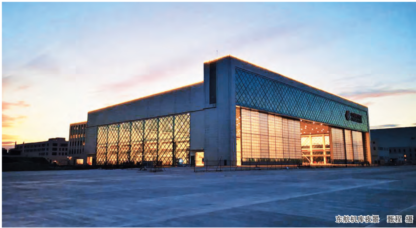
东航机库夜景

本报讯(记者李晓宇 通讯员杨旭东)近日公司接连中标怀柔区战勤保障消防站、训练基地及桥梓消防站“三合一”工程和成都天府国际机场东航航空食品生产区项目,总中标价约1.7亿元。 怀柔区战勤保障消防站、训练基地及桥梓消防站“三合一”工程的建设是落实完善怀柔区消防基础设施建设,完善消防训练体系,提升应急救援能力建设的需求。项目位于怀柔区桥梓镇后桥梓村,总建筑面积16000平方米,中标价9303.74万元。该项目集普