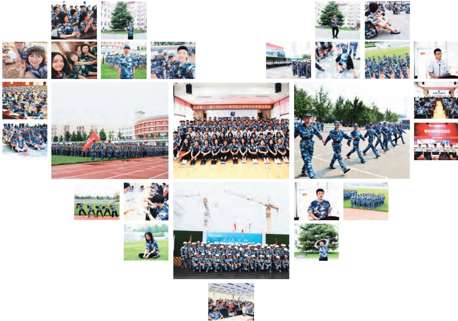
高集体观念和团队精神,激发新员工的责任感。

公司在集团培训的基础上,另外增加了3天的企业内训,聚焦公司企业文化的灌输、各业务系统基本业务知识流程的宣贯,使新员工更加直观且深入的认识公司,熟悉公司内部工作环境,增强企业融入感,同时尽快完成角色转换,提