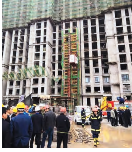
执行建筑起重机械安装拆卸专项施工方案、《施工升降机安全规程》《建筑施工升