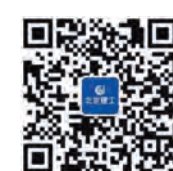
集团公司微信公众号

他希望各项目部要通过此次观摩会,进一步强化管理意识,立足于现实,能改即改,日事日毕,日清日升,实现持续改进,不断提高项目管理水平。