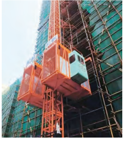
降机安装、使用、拆卸安全技术规程》等标准规范和安装使用说明书要求。