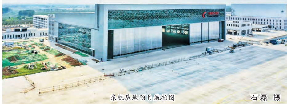
东航基地项目航拍图

北京新机场东航基地项目机务维修及特种车辆维修区一期工程(简称北京新机场东航基地项目工程),位于北京大兴区榆垓镇、礼贤镇和河北省廊坊市广阳区之间,北京新机场用地红线范围内。建设单位为中国东方航空股份有限公司,设计单位为中国航天建设集团有限公司。占地面积为189826平方米,建筑面积为84653.87平方米,包括机库及附楼、业务楼、航材库、北区能源动力中心等15栋单体建筑,工期总日历天数640天,开工日期为2017年9月28日;项目于