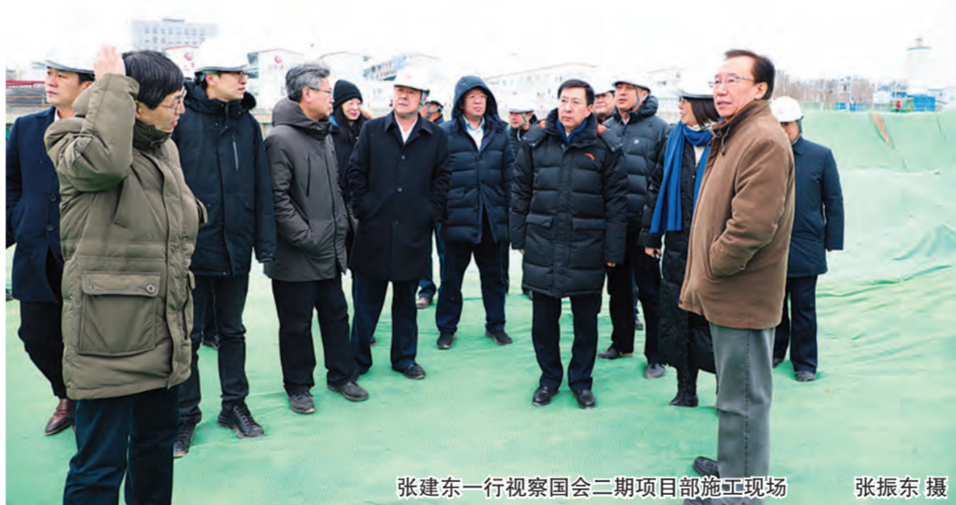
张建东一行视察国会二期项目施工现场

北京冬奥人才公租房项目是冬奥会重要非竞赛类场馆之一,赛时为各国运动员与随队官员提供住宿、餐饮、医疗等服务,赛后作为人才公租房,面向符合首都城市战略定位的人才配租。国会二期项目建成后将为北京冬奥会主新闻中心(MPC)、国际广播中心(IBC)进行赛事转播提供重要支持。张建东强调,两项工程对保障北京市冬奥会、冬残奥会的顺利举办具有重要意义,参建企业要以大型国企高度负责的态度,承担起国有企业的使命与责任,在冬奥重点工程建设中树立典范和标杆,在参与冬奥设施建设过程中助力北京市经济高质量发展,在2019年一季度实现经济社会发展开门红。在施工生