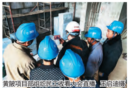
黄陵项目部组织职工收看大会直播