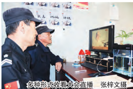
多种形式收看大会直播

在观看过程中我仿佛进入了时光隧道，使我能够近距离瞻仰邓小平南方谈话的资料照片，一个个改革开放的地标，生动讲述了40年来人民生活翻天覆地的变化，一件件带着历史气息的展品，见证了40年来民众的获得感、幸福感、安全感大幅提升，人民对美好生活的向往正在逐步实现。