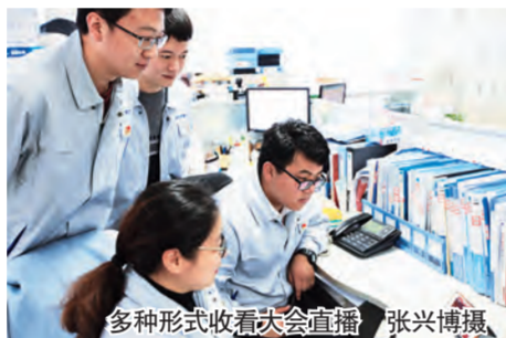
多种形式收看大会直播