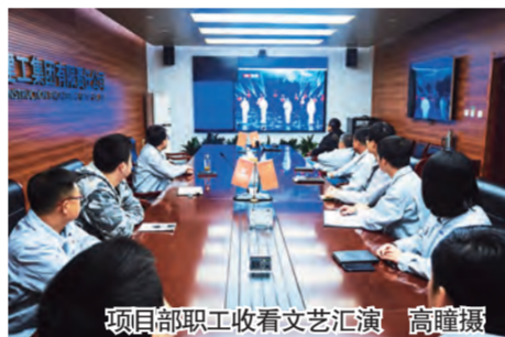
项目部职工收看文艺汇演