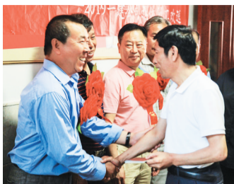
本报讯(通讯员 秦一夫)5月29日,公司党委、公司工会组

织十八名退休员工开展游园暨集体欢送活动。这也是2008年建立退休员工集体欢送机制以来,公司第十六次为退休员工举行集体欢送活动。