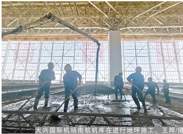
大兴国际机场南航机库正在进行地坪施工。

衢州“两中心”项目启动了“四赛、四比”劳动竞赛,重点聚焦质量、进度、安全、场地管理、后勤管理等五个方面,以贴红旗、黄旗、黑旗的方式实施考核,使各个分包队伍的综合管理水平、作业面进度一目了然,无形中向每天参加生产例会的队