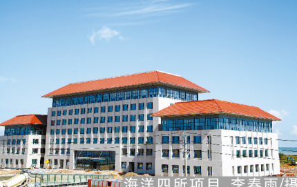
海洋四所项目

品质的施工质量迅速在广西北海市流传开来。北京建工人在北海市创造了一个奇迹,擦亮了北京建人的金字招牌,为进一步开拓北海市场奠定了坚实基础。