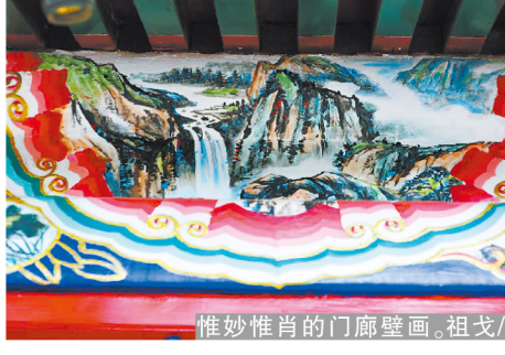
惟妙惟肖的门廊壁画,祖戈/摄

建工品牌,项目团队从安全文明施工上着手。黄色显眼的警戒线内设置2米多高的全封闭式围挡,各项安全标识张贴在围挡之上,围挡内挂着厚厚的防尘网。中午时分,项目安排洒水车在施工现场洒水,避免扬尘,每天还至少清理三遍以上现场建筑垃圾,维护施工现场环境整洁。