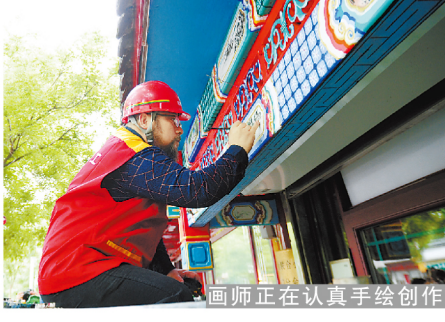
画师正在认真手绘创作

将原有的门漆敲掉,用猪血桐油刷在门上,待七八分干的时候,趁着湿劲压入麻丝,然后从粗灰到细灰依次粉刷上五遍,干后再刮上专用腻子,最后刷上三遍油漆,这种“一麻五灰”的工艺虽然复杂,但是门修缮出来的效果非常的好。项目人员介绍,天气好的时候,一幢门修缮完成也需要将近15天。