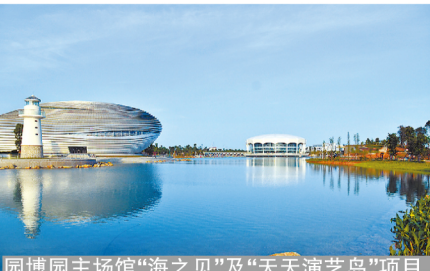
园博园主场馆“海之贝”及“天天演艺岛”项目

为了保证工期进度,项目团队克服了高温多雨等困难,圆满完成了工程建设任务。在工程竣工不久,北海市遭遇历史上罕见的17级台风,工程面临着严峻的质量考验。台风过后,园博园主场馆没有吹掉一砖一瓦,高