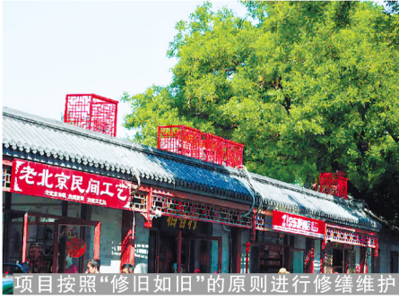
项目按照“修旧如旧”的原则进行修缮维护

看似简单的门廊壁画,里面却有很多的讲究。首先要将门廊上加上外墙面防水灰,灰面必须平整,然后在上层筑漆,待干后加入丙烯颜料,才能进行绘画。在门廊之上绘画,不比纸上,要特别注意画面工整和颜料搭配,色彩的明暗只有靠多年的经验才能判断,这样的壁画才会更加具有观赏性。