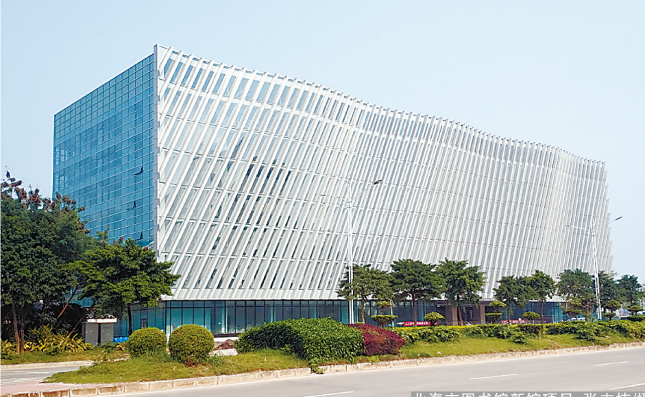
北海市图书馆新馆项目

编者按: 2019年,是集团总承包部扎根广西北海市场辛勤耕耘的第六个年头。六年来,总承包部紧盯“一带一路”倡议下的北海建筑市场,坚持“以现场赢市场、抓生产不忘开拓市场”的营销理念,深耕细作广西北海区域市场,承揽了广西园博园主场馆、北海市图书馆新馆、北海市体育馆、海洋四所等8项工程,并挥师北上,承揽南宁航空运营中心项目。