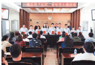
(通讯员 杨华)为表彰和

宣传在公司各条战线上表现突出，工作有能力、有思路的优秀青年知识分子，展示公司青年奋发向上的青春风采，发挥榜样示范作用，公司团委举办了2019年度“五·四”青年节主题活动暨2018年度“十佳青年”评选表彰大会。会上公司全体团员重温了入团誓词，观看了“十佳青年”纪录片，三名“十佳青年”代表表态发言。