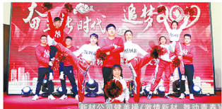
新材公司编舞《激情新村 舞动青春》