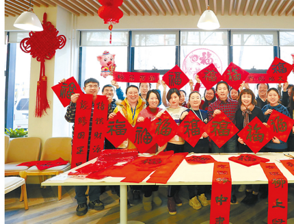
装饰集团职工写“福”字，迎新春

此外，总承包部、修复公司、产业化公司等单位也都开展了走访慰问活动，将祝福和温暖送到职工群众的身边。