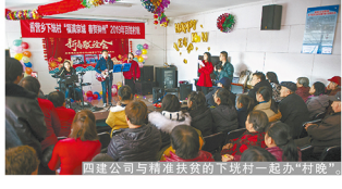
四建公司与精准扶贫的下坑村一起办“村晚”