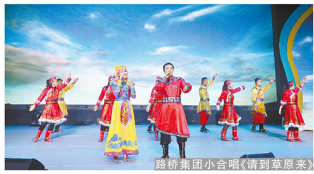
路桥集团小合唱《请到草原来》

建筑集团总承包部、技术公司、六建集团、新材公司等单位也都举办了职工联欢活动，大家以演唱、舞蹈、相声、相声等艺术形式，传递新春祝福，也为新的一年积蓄了“撸起袖子加油干”的强大力量。