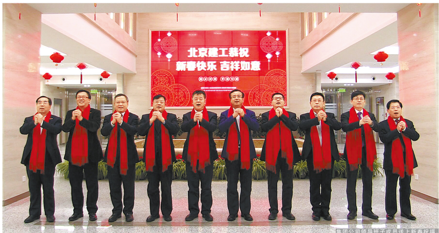
集团公司领导班子成员送上新春祝福