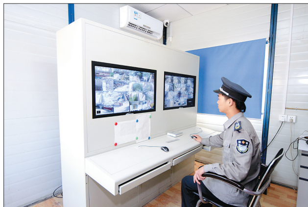
利用监控系统、安保系统、消防报警等系统,大大减少了人员配备,提高了工作效率。

消防演练。结合工程实际,组织作业人员进行扑灭初起火灾、疏散逃生演练,提高人员自身疏散逃生能力。