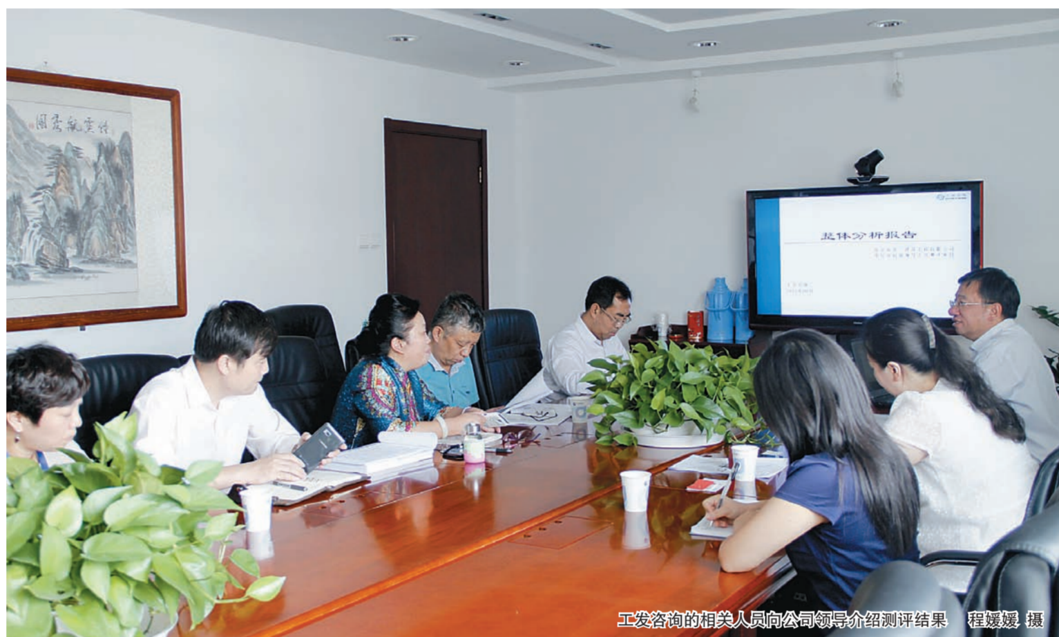
工发咨询的相关人员向公司领导介绍测评结果

单位研究提出推荐人选,第三步考察组进行资格审查、测试及确定阶段。确保了后备领导人员推荐既有群众基础、又有组织意见,既重能力素质,又重思想品德。