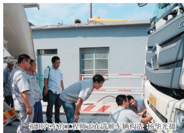
福州汽车公司的工程师正在讲解车辆构造