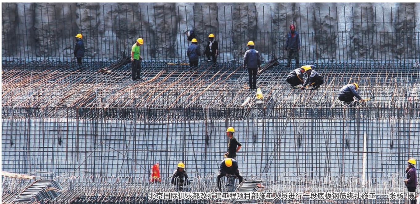
北京国际俱乐部改扩建工程项目部施工人员进行一段底板钢筋绑扎施工。

入落实到各劳务队,各班组,制定了有针对性考核制度,充分调动全体人员参与生产的热情,人人干劲十足。