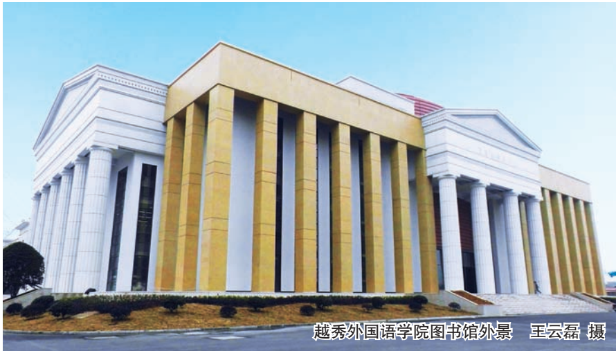
越秀外国语学院图书馆外景

用大体量彩色清水混凝土进行工程建设成功经验可供借鉴。为了追求设计效果,项目部精益求精,不畏繁琐,与建研院材料所开展合作,联合对红、黄两种颜色彩色清水混凝土配比进行攻关。大家一头扎进彩色清水混凝土的试配,不断尝试,逐步调整颜料与外加剂,使用不同配合比进行反复试验,历时半年之久,最终试配出了具有高性能的彩色清水混凝土,完美演绎了设计意图。