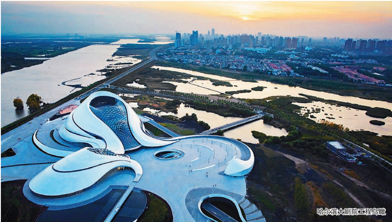
哈尔滨大剧院工程鸟瞰

项目部在开工伊始就明确了誓夺鲁班奖的质量目标,成立了以项目经理为核心的质量创优保证体系,制定了33项质量