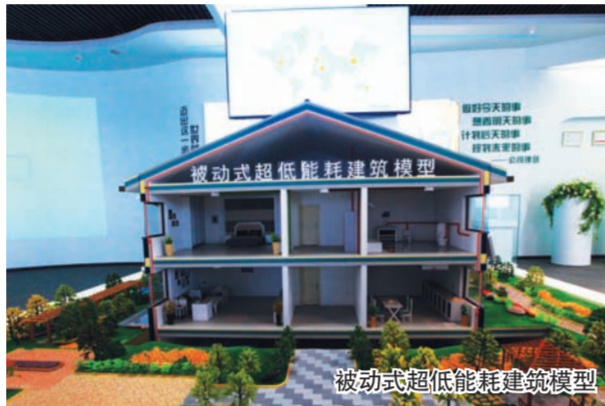
被动式超低能耗建筑模型