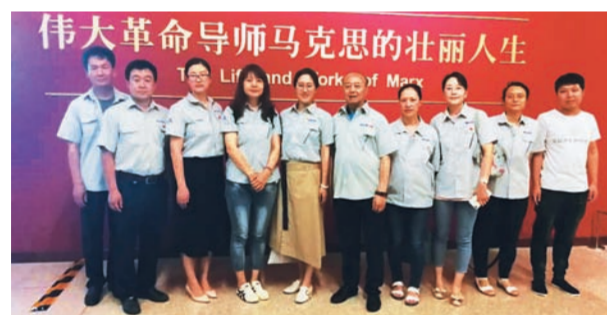
伟大革命导师马克思的壮丽人生

本报讯(记者刘亚敏)6月26日,公司组织员工前往国家博物馆参观了“真理的力量——纪念马克思诞辰200周年主题展览”,公司共计34名职工进行了参观。