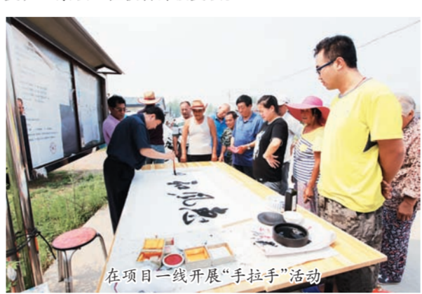
在项目一线开展“手拉手”活动

与此同时,公司始终与国家同呼吸、共命运。在上个世纪六七十年代,公司上万人投身湖北十堰汽车城建设,三建人凭着这种“敢打能胜”的钢铁精神,圆满完成了非典时期SARS病房楼改造、汶川震后援建、援建什邡、援建新疆、“7·20”怀柔三岔村抢险、湘江抢险等任务,用钢铁意志和实际行动诠释了首都国企的责任担当。