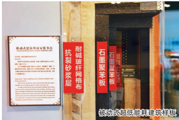
被动式超低能耗建筑样板