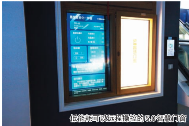
低能耗可以远程操控的5.0智慧门窗

和支持,目前,全球约有50000个被动式标准的居住(使用)建筑单位,其中欧盟、美国、英国、日本、韩国等国家也相继制定超低能耗建筑发展目标和技术政策,建立适合本国特点的超低能耗建筑标准及相应的技术体系,超低能耗建筑正在成为建筑节能的发展趋势。 当前,北京市、河北省等已经陆续发布有关大力发展被动式超低能耗建筑的鼓励政策,被动式超低能耗建筑即将成为我国建筑业的下一个产业发展方向。此次参观对于集团开拓被动式建筑设计及建造思路、组织好承接被动房工程项目,将起到积极的推动作用。