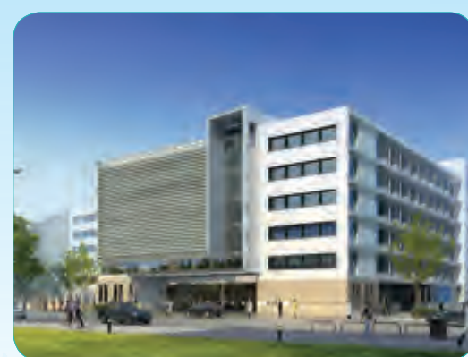
武警北京市总队医院医疗综合楼工程

建筑面积45935平方米,由5个子项组成,包括一栋12层的行政办公大楼,一栋6层技术用房、东西3层配楼和一个大型地下车库,建成以后主要用于行政办公和业务咨询。