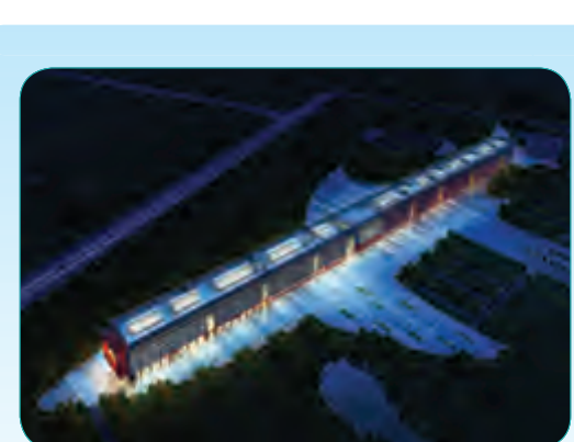
新疆公安警察培训基地工程

位于辽宁省沈阳市沈北新区虎台南街57号,建筑面积为57034平方米,包括土建、排水、采暖、强弱电等部分,建设单位为沈阳首开盛泰置业有限公司,将于2015年11月30日竣工。