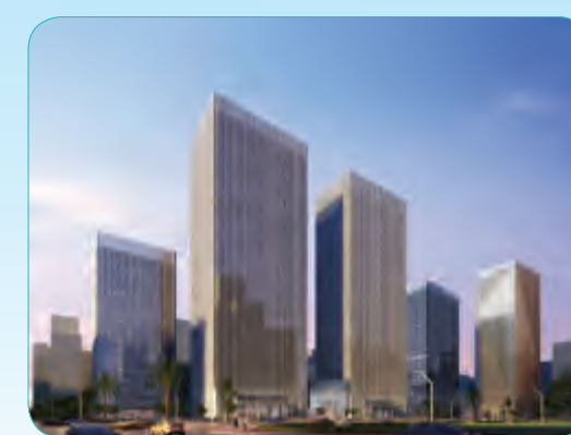
海南海阔天空国瑞城二期S5地块总承包工程及16000吨钢结构安装工程

施工的主体部分包括日处理能力100万吨的生物滤池、膜处理车间、臭氧接触池、紫外线消毒车间及其附属构筑物等19项单项工程,整个工程预计于2015年建成并投入使用。