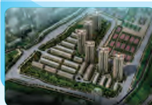
重庆市杨家山片区商住项目(一期)1号地块工程

总建筑面积为59188平方米,大厦主楼地上15层,地下3层,建筑檐高59.4米,是首钢工学院、首钢篮球中心的配套设施,由主楼、多功能厅、能源中心组成。