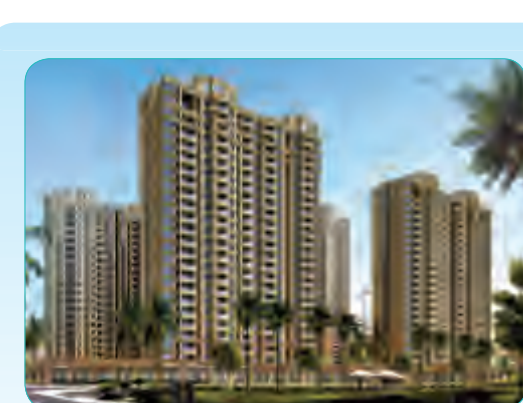
海阔天空国瑞城S4地块总承包工程

由8栋单体结构组成,总面积14万平米,地下2层,地上8层,是集教学培训、科技研发、学术交流、行政管理、配套服务等综合功能于一体的建筑群。