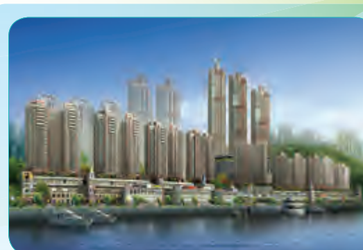
和记黄埔重庆南滨路商住二期后两排总承包工程

建筑面积26.8万平方米,分成1A分区及1B分区两个总承包工程,工程开工日期为2013年2月,1A分区总工期为600天,1B分区总工期为720天。