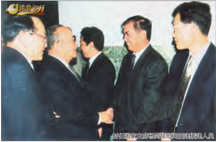
时任国家主席杨尚昆慰问四建建设人员