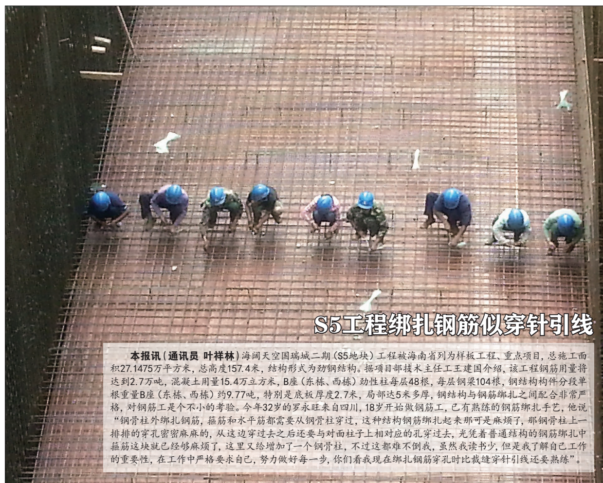
S5工程绑扎钢筋似穿针引线

地下室是稀缺资源,仓储销售项目在此独占优势。但同时发现,要想实现销售速度与销售价格的双赢局面,地下仓储使用功能单一是最大的障碍,通过设计部、销售部、工程部的实地勘察和商议,最终确定将地下仓储进行上下水的改造,使得地下仓储的使用功能更为丰富。四建地产的销售从无到有,经历了限价房、廉租房,商业、仓储的各种销售类型。四建地产销售部目前已建立一套完善的销售流程,积累了宝贵经验,为今后怀柔回迁房销售及房地产销售业务奠定了良好的基础。