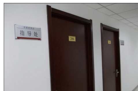
沈阳市政府迁入后的大厦内景

10月7日国庆假期最后一天的晚上,在浑南区沈中大街206号的沈阳市规划大厦,人们发现该大厦部分楼层正亮着灯,数名工作人员正在忙碌地搬运着办公桌,值班门卫也透露,“十一”放假期间,确实有单位启动了搬迁工作,不过“大规模搬还是要等到节后”,这就表明,沈阳市政府已经确定要整体迁入沈阳市规划大厦了,而作为沈阳市规划大厦的建造者,四建公司包括沈阳规划大厦项目部在内的全体员工感到万分自豪。