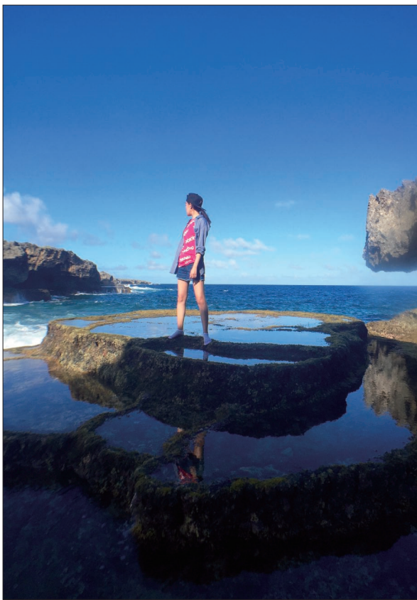
三十岁之前,一路上遇见的人或如左右手般十指连心,或

止于几面之缘,来去洒然,不落爱憎。我时常在想,若我有一女儿,只愿她生的小巧惹人,一生都过的静静的,再得一眉眼温良的男孩子疼爱,是以完满。不愿她像我,本没有独当一面的力量,却又倔强的什么都舍弃,一个人走过生活中的风雨时分,塞着耳机就错觉拥有了全世界的陪伴。年少时热切真挚,想旅行背起包就走,翘课去看演唱会,想吃的东西一定要吃个够,想做的事多疯狂也要去做,完美的演绎了年轻这两个字蕴含的所有定义。那些曾经被挥霍青春充斥大脑的我,并不懂那些书里所写的平时的生活,直到日复一年的成长,才开始了解,这些阶段性的温柔与清决,是上天给的馈赠。那些青春里的人,在30岁的转盘上逐个回归轨道,我也渐渐从安静的时间里,从最开始的怨念,到后来工作之后,也可以一个人照顾好生活,并且热爱它。也会伤心和沮丧,但总是心宽到睡一觉就全忘掉,活得自由又坦荡,无关昌盛与否。就像看书的时候读到的那句话:“我的生活经常丧失一切出路,但那依旧是我的自由”。归根结底,忠于内心才能得到精神上的自由与富足。