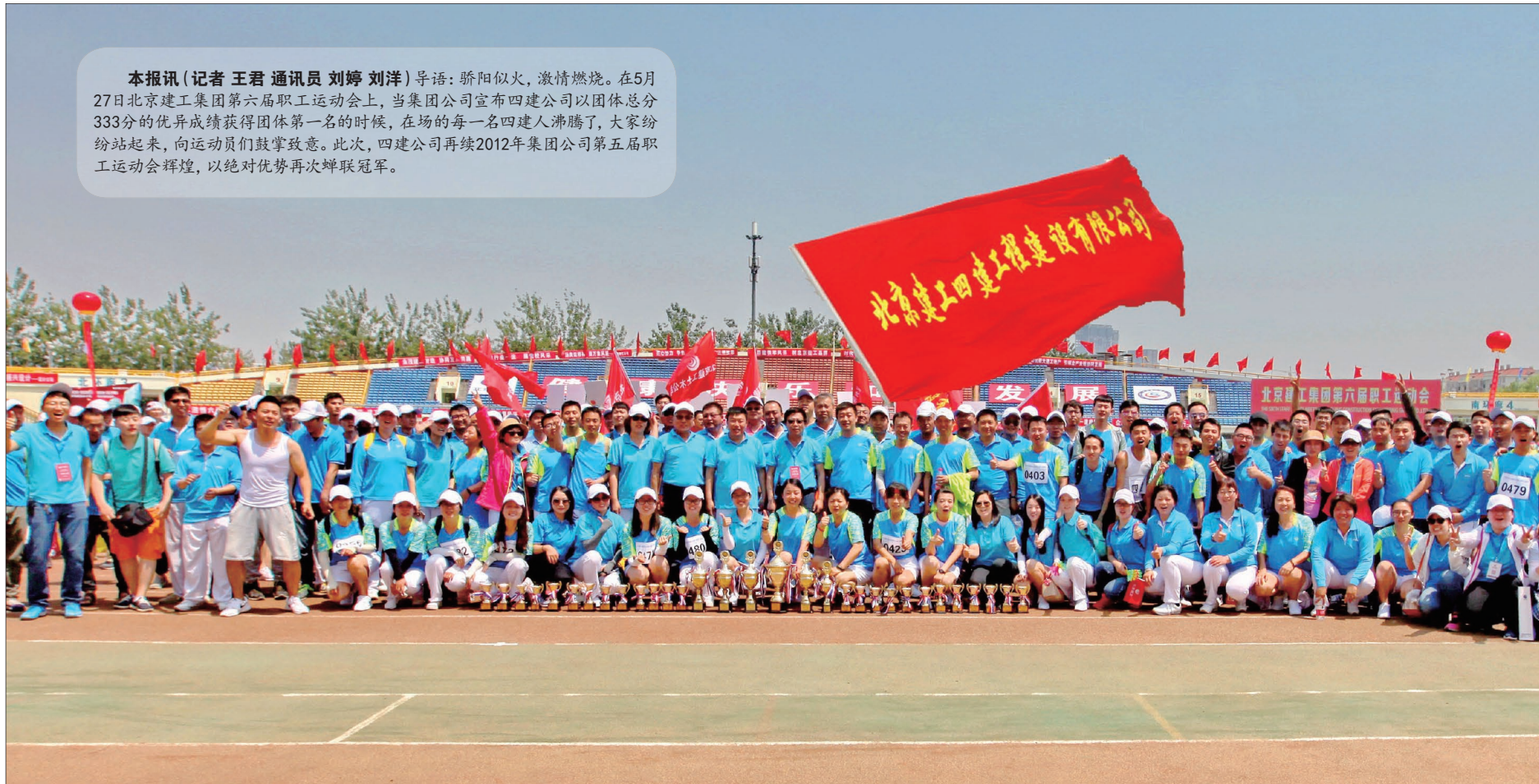
本报讯(记者王君 通讯员刘婷 刘洋)导语:骄阳似火,激情燃烧。在5月27日北京建工集团第六届职工运动会上,当集团公司宣布四建公司以团体总分333分的优异成绩获得团体第一名的时候,在场的每一名四建人沸腾了,大家纷纷站起来,向运动员们鼓掌致意。此次,四建公司再续2012年集团公司第五届职工运动会辉煌,以绝对优势再次蝉联冠军。

蟾宫折桂 428米高海口塔、350米高国瑞、西安金融中心、288米高海口中心等超高层工程花落北京建工四建,他们是市场上的建筑铁军;16个冠军、9个亚军、8个季军、团体总分333位居第一,他们是赛场上的运动会冠军!