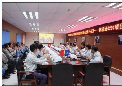
新机场安置房0201项目部