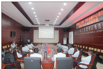
国瑞·西安金融中心项目部