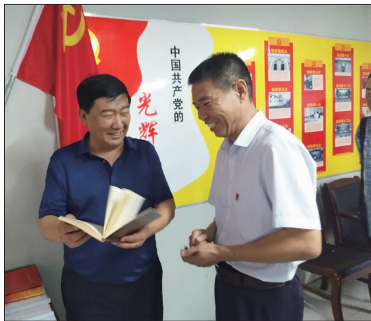
查看廉政教育笔记