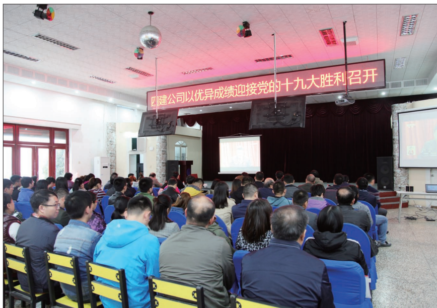
公司组织收看党的十九大开幕式