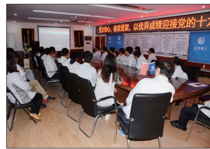
通州两站一街项目部