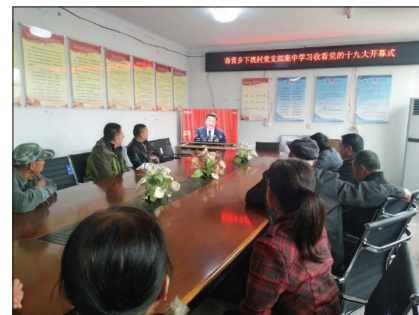
共建单位香营乡下垈村党支部